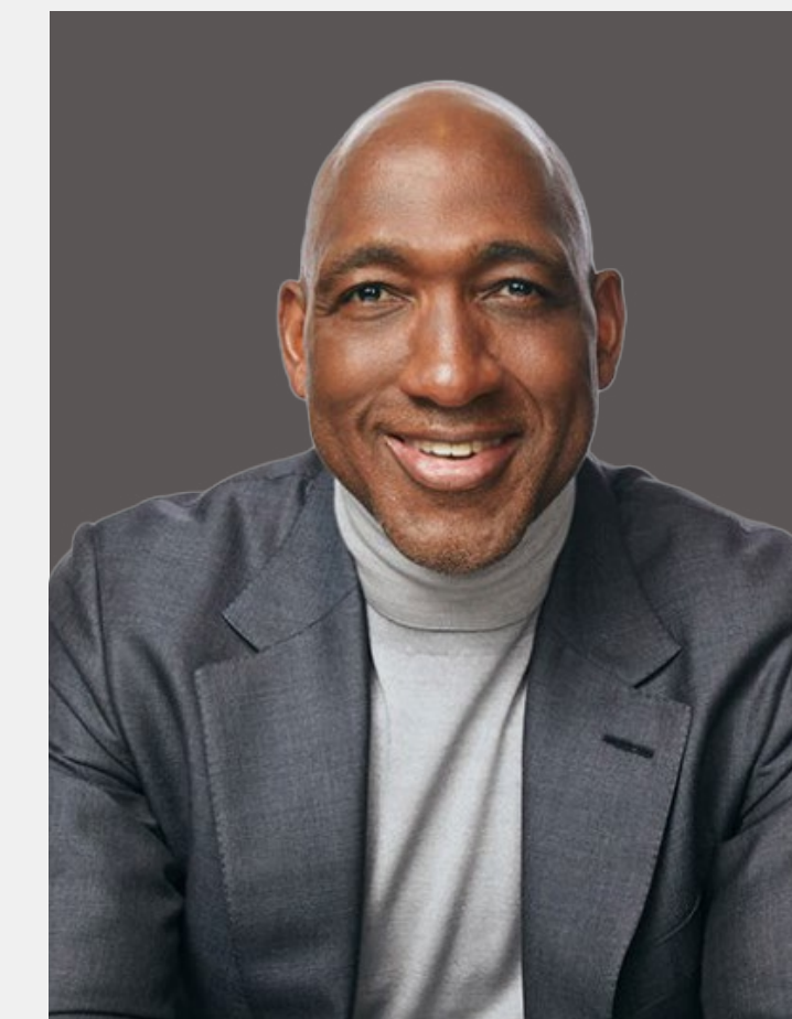
Derica W. Rice Az auditbizottság elnöke A Bristol Myers Squibb igazgatótanácsa